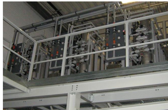
Membrananlage auf einem Podest

Aufgrund des sehr begrenzten Platzangebotes wurde die neue Verfahrensstufe auf einem Podest über den bestehenden Waschmaschinen installiert. Durch diese Vorgehensweise konnte mit überschaubarem Aufwand eine sehr große Wirkung erzielt